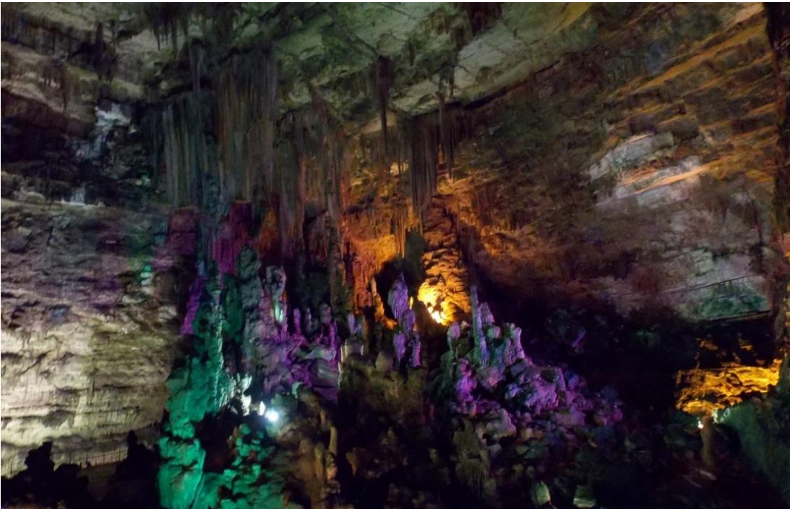
GROTTE DI CASTELLANA