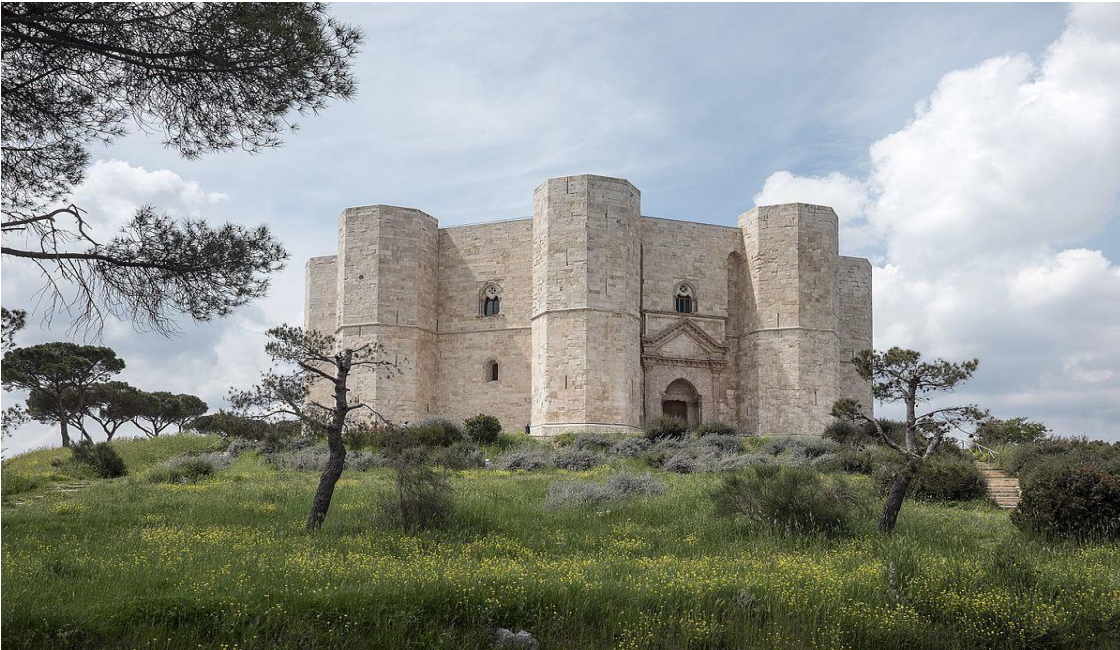
CASTEL DEL MONTE - ANDRIA