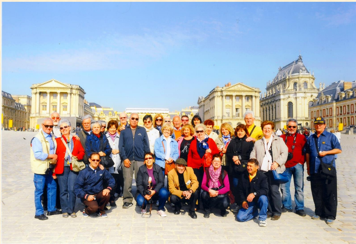
CHATEAU DE VERSAILLES